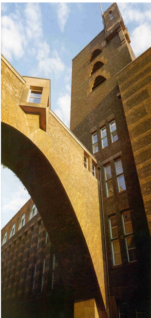
Bild: Turm und Brücke AEG Berlin

Die AEG galt bis zu ihrer Auflösung im Jahre 1996 als bedeutendes und traditionsreiches deutsches Industrieunternehmen. Das Unternehmen wurde 1883 von Emil Rathenau als ‚Deutsche Edison Gesellschaft für angewandte Elektrizität‘ gegründet und 1887 in ‚Allgemeine Electricitätsgesellschaft‘ (AEG) umbenannt. Zu Beginn produzierte die AEG Glühlampen und Dynamomaschinen. Bald wurde ihr Tätigkeitsfeld jedoch auch auf weitere Bereiche wie zum Beispiel Kaffeemaschinen, Messgeräte, Elektromotoren oder Schienenfahrzeuge ausgeweitet. Durch diese Expansionsmassnahmen stieg die AEG bis 1914 zum grössten Hersteller der Elektroindustrie auf.