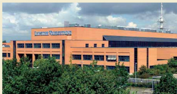
Zeitungsdruckerei Leipzig Druckereistraße 1 04159 Leipzig