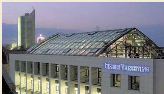
Leipziger Verlags- und Druckereigesellschaft mbH & Co. KG Petersteinweg 19 04107 Leipzig