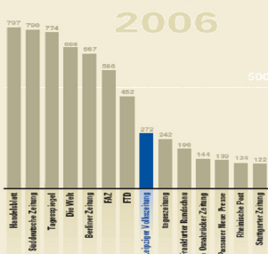
Die Leipziger Volkszeitung zählt zu den meistzitierten Abonnementzeitungsteilen. Das ist das Ergebnis einer Untersuchung der Anzahl der Zitate im Politik- und Wirtschaftsteil von 39 tonangebenden deutschen Medien.